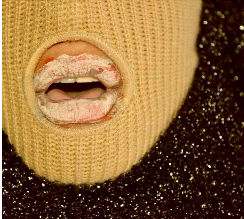
Élisa Violette Mascare, cagoulée, aux lèvres d'argile et de rouge à lèvres, récite du Nelly Arcan - détail - photo de répétition

Le dispositif de diffusion sonore sera partie intégrante de la scénographie, aussi bien dans sa dimension immersive (enceintes à 360°) que fictionnelle (pour reconstituer la grotte Arcanes).