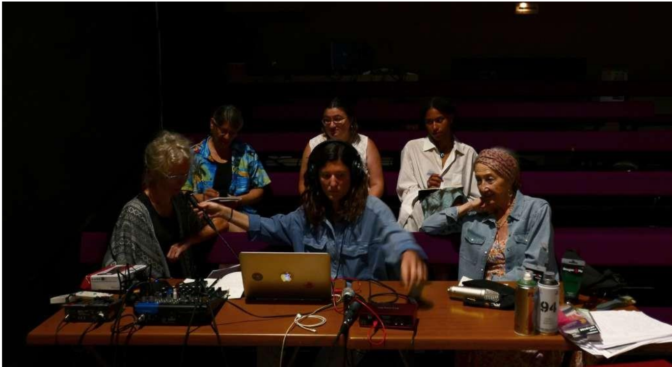
Prises de sons avec un groupe d'amatrices lors des ateliers d'écriture/voix menés au cours de la résidence au Théâtre de la Cité , juin 2023